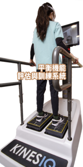
平衡機能 評估與訓練系統

大樓設立了定位腦磁激療法項目，使中風患者完成相關治療後再接受密集式復康治療，效果更加顯著。